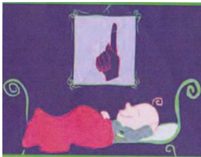
da "Genitori più"